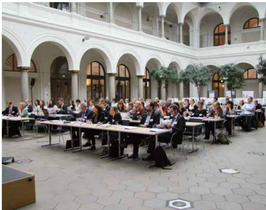
SEMPRE projekta pirmā konference 2016. gada septembrī Berlīnē.