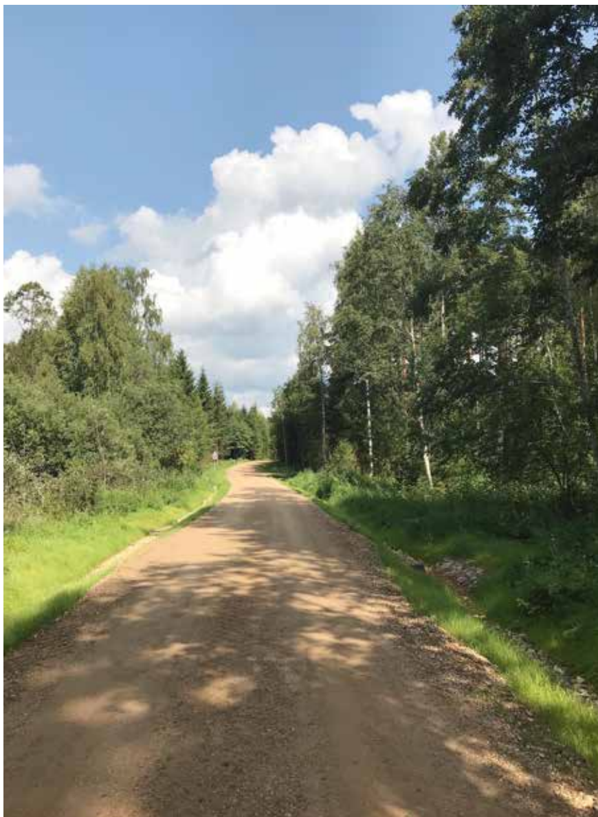
Zemesceļš Kurzemē 2018. gada vasarā.