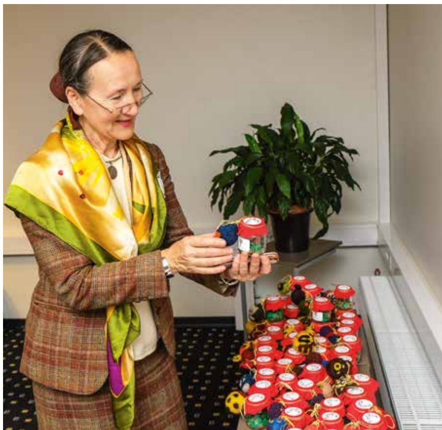
Antistresa bumbiņas no filca, domātas bērniem ar attīstības traucējumiem, papildinātas ar saritinātām citātu lapiņām no Bībeles. Izgatavotas mikroprojekta ietvaros Harkujervē ( Harkujärve ), Igaunijā.