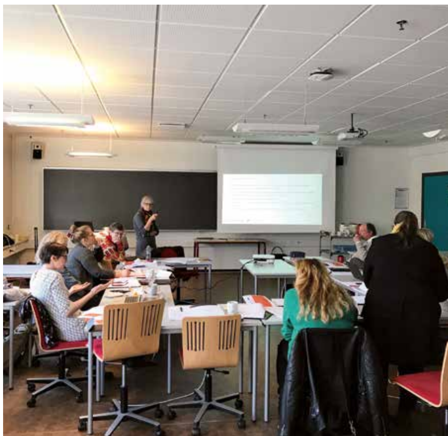
Seminārā par mācībām rīcībā 2017. gada 27. februārī Esbjergā.