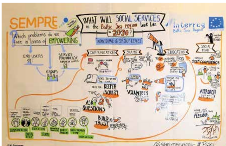
Nākotnes darbnīcas darba grupas ideju grafiskā vizualizācija noslēguma konferencē 2018. gada 27. novembrī.