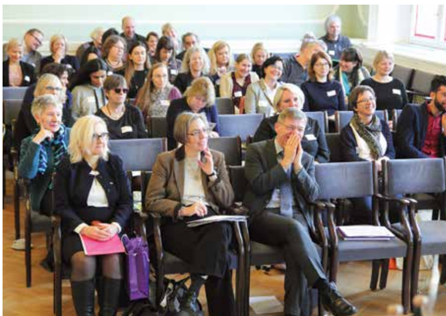
Starptautiskā projekta “Sociālā spēcīgāšana reģionos” (SEMPRE) noslēguma konferences dalībnieki 2018. gada 27. novembrī Latvijas Universitātes Mazajā aulā.