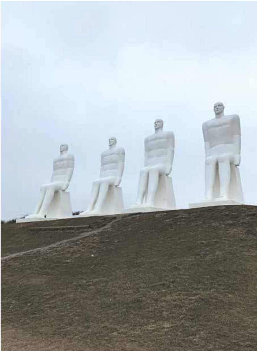
Četri cilvēki jūras krastā raugās uz horizontu, kur jūrasceļš var aizvest uz visām četrām debespusēm. Esbjerga, Dānija.