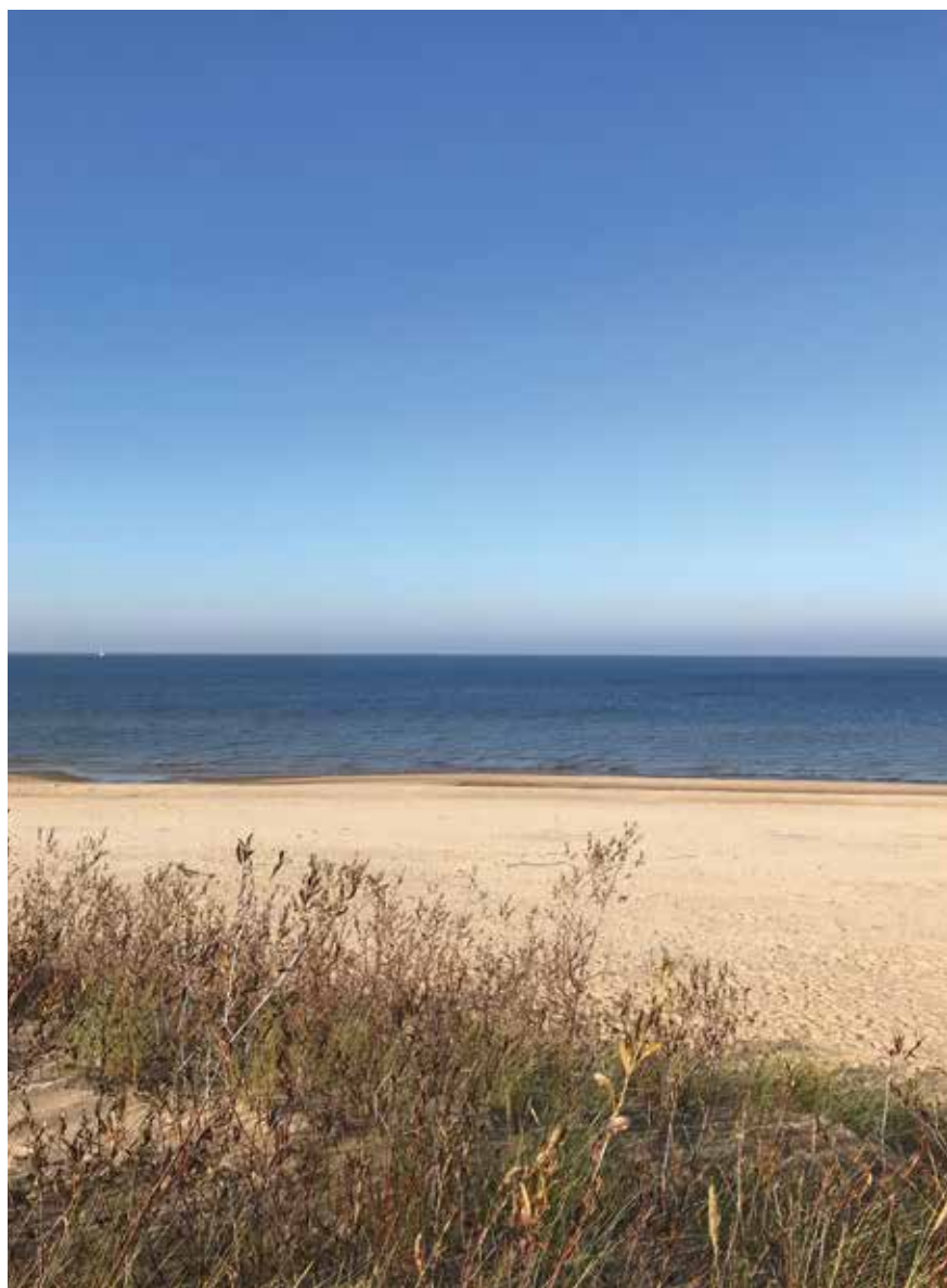
Rīgas jūras līcis, dabas parks "Piejūra".