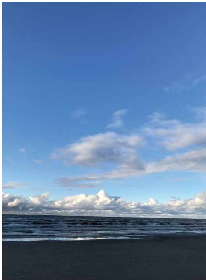
Baltijas jūra Kurzemē.