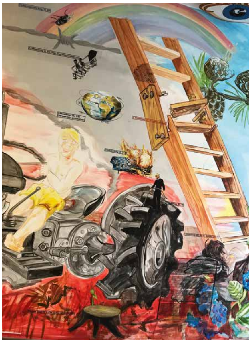
Kāpnes augšup mūsdienās. Fragments no Ērika Hagensa sienas gleznojuma “Jaunais evaņģēlijs”.